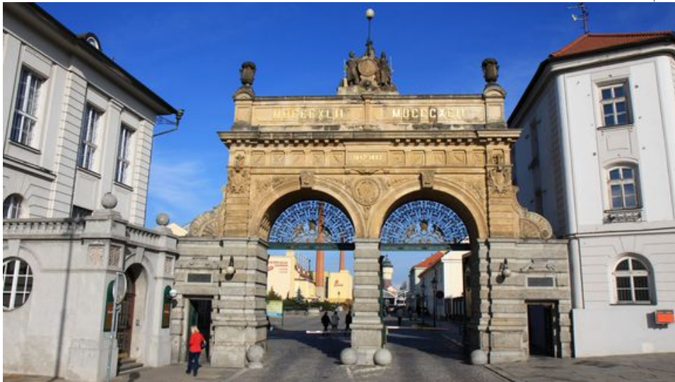
Werkstor der Pilsner Urquell Brauerei in Pilsen

Pilsen ist nicht nur der Name einer kleinen Stadt im Westen der Tschechischen Republik, Pilsen ist auch ein Triggerwort. Wenn man in Deutschland jemandem erzählt, dass man nach Pilsen fährt, bekommt man immer dieselbe Geste zu Gesicht: Eine Faust, von der Daumen und kleiner Finger abgespreizt sind, wackelt etwa eine halbe Sekunde lang vor dem Mund auf und ab. Das ist das internationale Geheimzeichen der Biertrinkerloge.