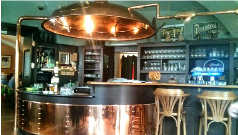
Restaurant-Dekoration in Pilsen: ein ehemaliger Brauereikessel